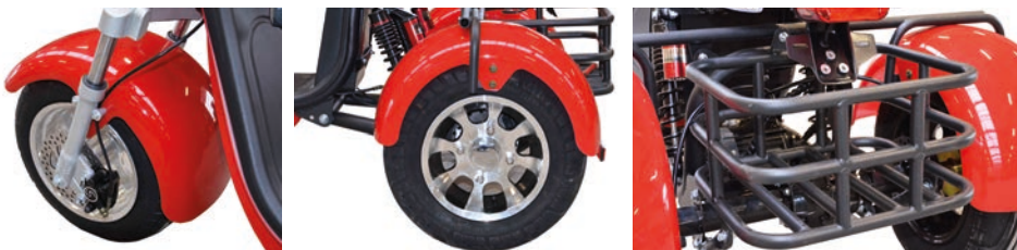
Alufelgen, Scheibenbremsen vorn und hinten, Teleskopgabelfederung vorne, Schraubenfederung und Stoßdämpfer hinten Rohrrahmen Transportbox zwischen den Hinterrädern