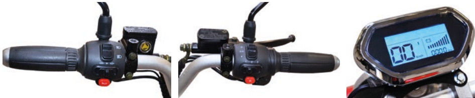
Lenker mit Bedienung für 3-stufige Geschwindigkeitsregelung, Rückwärtsgang, Fern/- Abblendlicht, Blinker, Hupe Digitale Tachoanzeige