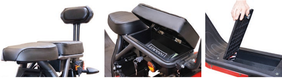
Doppelsitzbank mit verschließbarem Staufach, Rückenlehne Staufach verschließbar