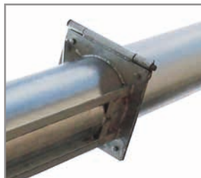
Option: Auslauf mit Klappgelenk inkl. Zwischenlager