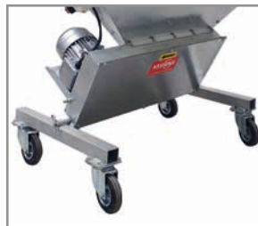
Option: Lenkrollen unter dem Einlauftrichter