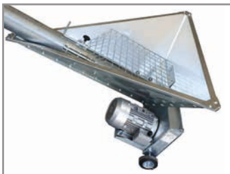
Einlauftrichter mit Mengenregulierung und Laufrollen

Auf Wunsch erhalten Sie weitere Varianten individuell auf Ihre Bedürfnisse zugeschnitten.